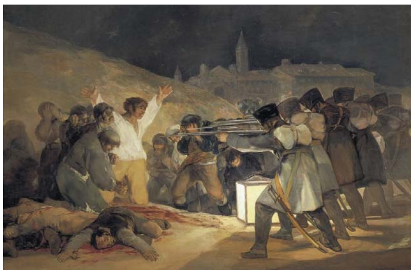
Fig.2 Puntuación máxima: 2 puntos