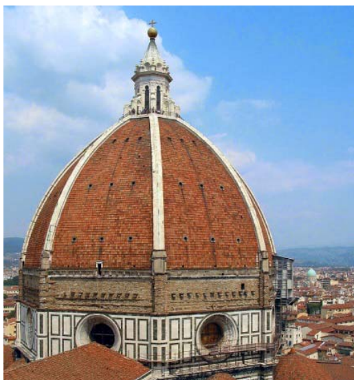
Fig.1 Puntuación máxima: 2 puntos

Analiza y comenta las dos obras de arte presentadas: