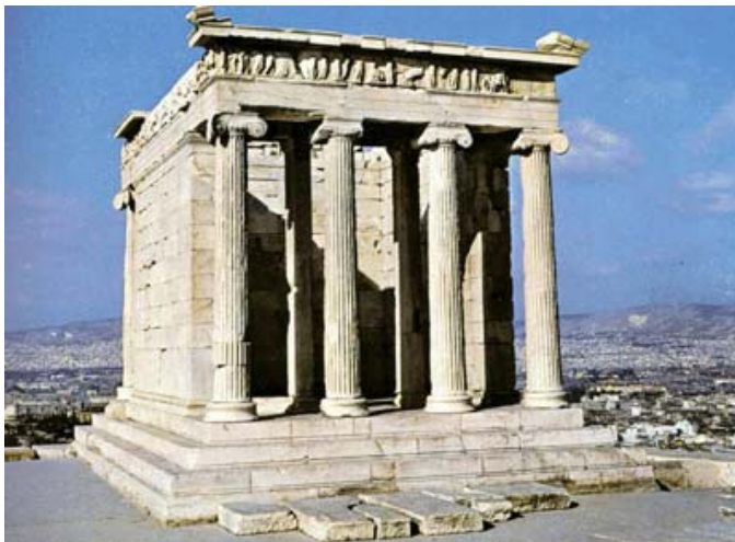
Fig.1 Puntuación máxima: 2 puntos

Analiza y comenta las dos obras de arte presentadas: