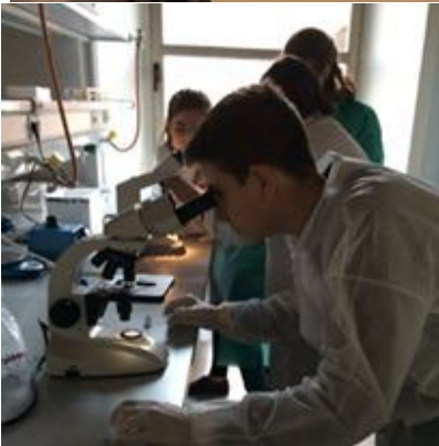
Laboratorios de docencia