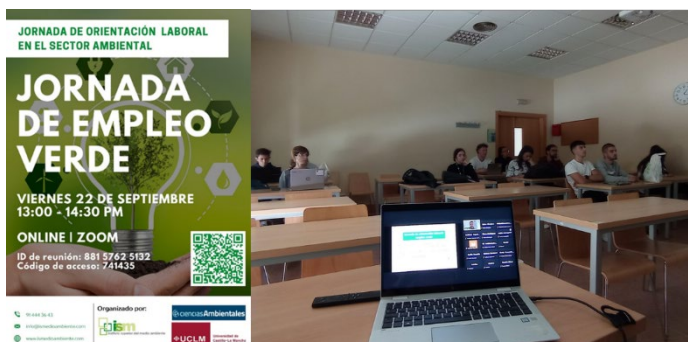
Imágenes de la "Jornada de orientación laboral en el sector ambiental. Jornada de empleo verde"