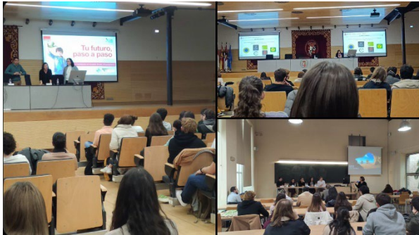
Imágenes de la "Jornada sobre orientación profesional y empleabilidad en Ciencias Ambientales y Bioquímica, 2024"