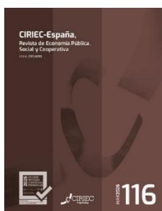
CIRIEC N° 116 Marzo 2026

Sortir de l'urgence écologique, passe critique de l'Anthropocène, en promouvant la transition vers une société post-croissance. Camproux Duffrène, Marie-Pierre.