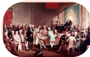
Famosa pintura de Howard Chandler Christy titulada 'Escena en la firma de la Constitución de los Estados Unidos, completada en 1940' / Capitolio de los Estados Unidos en Washington D. C.

En India, el jurista B. R. Ambedkar presidió el comité que elaboró la Constitución de 1950, pionera en derechos sociales y en la protección de la igualdad.