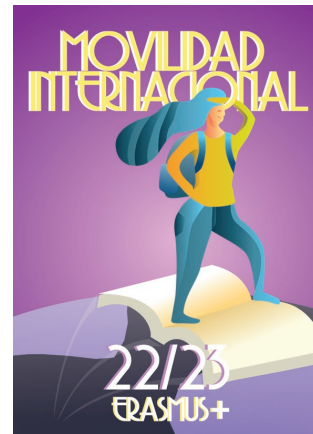
Cartel nº 20

Los argumentos del presidente del jurado en el ejercicio del voto de calidad al haber obtenido las dos propuestas finalistas (25 y 9) los mismos votos por su parte, son los siguientes: