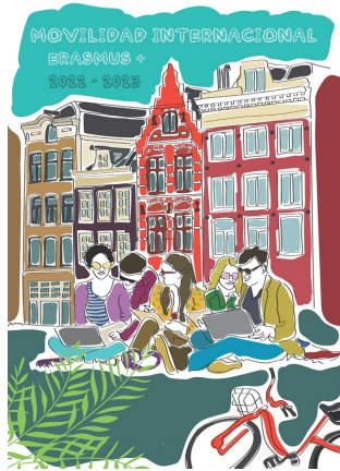
Cartel nº 9